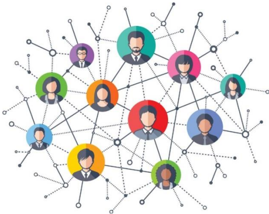
شکل ۱. نحوه تعامل کنشگران اقتصادی در رویکردی جامعه‌شناسانه به انسان اقتصادی

زیمل زیربنای اجتماعی پول را به شرح زیر تبیین می‌کند: «برای آنکه پول قابلیت استفاده یابد، باید مجموعه‌ای فراگیر و متکثر از روابط اجتماعی در جامعه برقرار شود (وگرنه هیچ فرقی بین پول و سایر کالاها وجود نخواهد داشت)، همچنین پذیرش جمعی و عقلانی آن (پول) متوقف بر افزایش و تشدید روابط اجتماعی است. بروز این پدیده‌های تظاهراتی (کنش‌های تقلیدی و روابط اجتماعی) نشان‌دهنده آن است که ماهیت ذاتی پول، هیچ ارتباطی با ماده آن ندارد؛ از آنجاکه پول تماماً یک پدیده اجتماعی و گونه‌ای از تعامل انسانی است، پس هرچه روابط اجتماعی متمرکزتر، درهم‌تنیده‌تر و سازگارتر باشد، ویژگی ذاتی پول تقویت می‌شود» (زیمل، ۲۰۰۴، ص ۱۷۱).