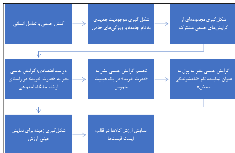
شکل ۴. پویایی اقتصاد براساس رویکرد جامعه‌شناسانه به انسان اقتصادی

ب) رویکرد جامعه‌شناسانه به انسان اقتصادی: پول خروجی الزامی و حتمی کنش جمعی و تعامل انسان‌ها با یکدیگر است. پدید آمدن پول این امکان را فراهم می‌کند که برداشت‌های ذهنی کنشگران اقتصادی از ارزش کالاها در مکانیسم‌هایی خاص به تولید فهرست قیمت کالاها بینجامد. پس عینیت ارزش در این نگاه ناشی از وجود پول و شکل‌گیری قیمت است نه انضمامی بودن ارزش کالا. در این نگاه، اساساً وجود نقطه‌های کانونی با عنوان قیمت‌های